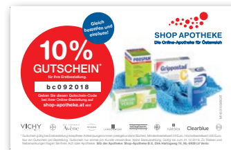
Einseiter Der „Webmaster“