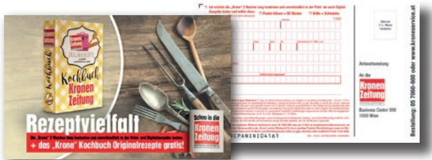
Kupon Der „Response-Klassiker“