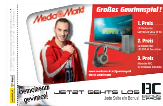
Cover-Promotion Der „Einmalige“