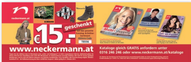
Panorama-Seite Der „Plakative“